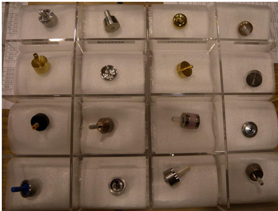
三遠南信特別出世場所に出場したコマ達