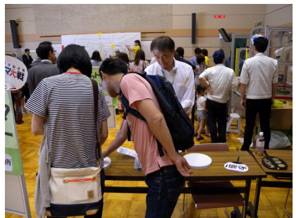
企業コマコーナー