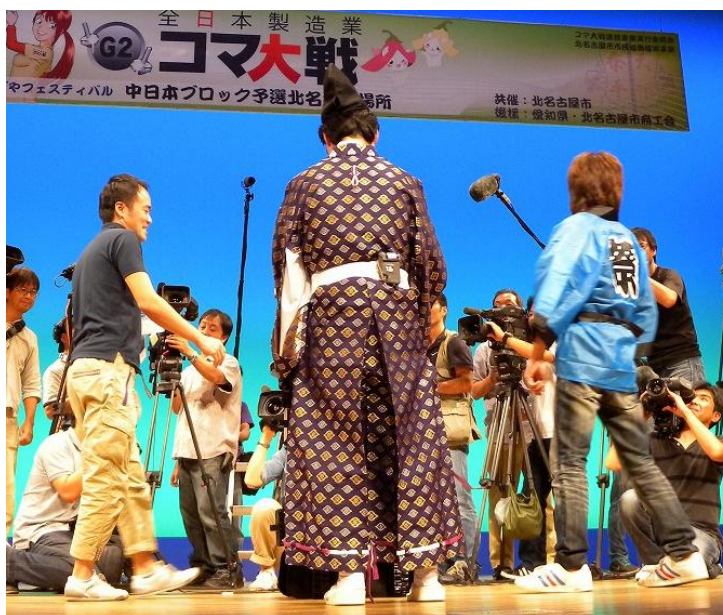
岐阜工場 対 久野金属工業 常滑工場

3 試合目：対 久野金属工業 常滑工場・・弊社勝利 相手は今年G 3 碧南場所で優勝した久野金属工業であった。 この試合に勝ち決勝に進めることになった。