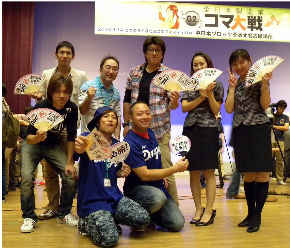
1次予選を突破した弊社の面々