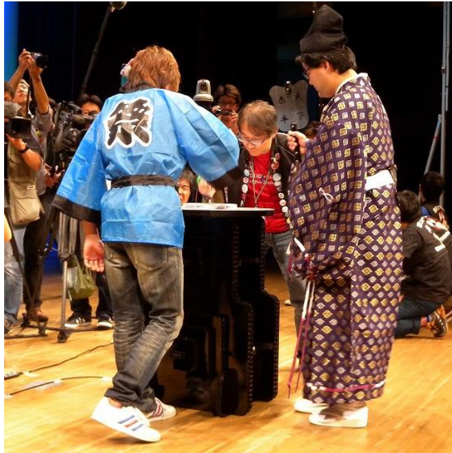
岐阜工場 対 信州コマ倶楽部 最初の1投