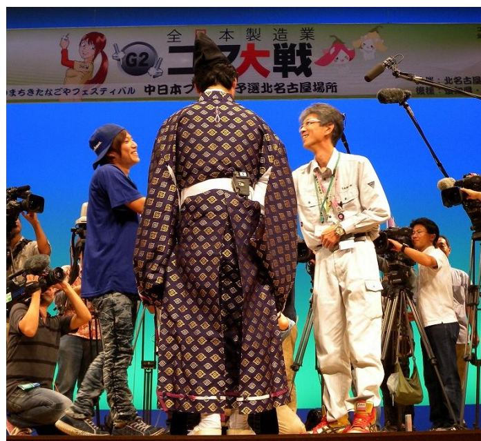
春日井工場 対 日成機工(株) 大戦後の握手