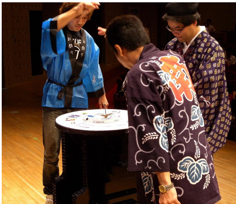
岐阜工場 対 (有)カジミツ

4 試合目 (決勝)：対 (有)カジミツ・・弊社負け この試合に勝てば優勝であるが相手はキセイレン場所の決勝戦で負けた(有)カジミツである。 キセイレン場所と同様 やはり普通のコマではない。変形コマである。 普通に大戦しては勝てる確率は0%であろう。 なんと相手の(有)カジミツのコマは現在まで勝率100%である。 さすが(有)カジミツ松宮社長 普通に出てくる筈がなかった。予想通りだ、いや予想以上のコマで 出場してきた。